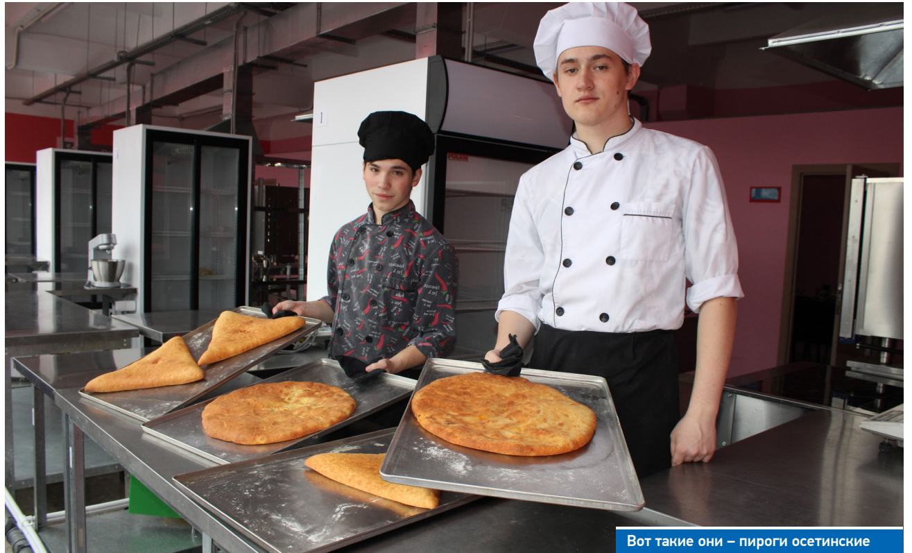
Вот такие они – пироги осетинские

Подготовка к престижному чемпионату молодых профессионалов требует не только усердия студентов, времени и опыта преподавателей, но и серьезных финансовых затрат. В среднем на подготовку к «Ворлд-