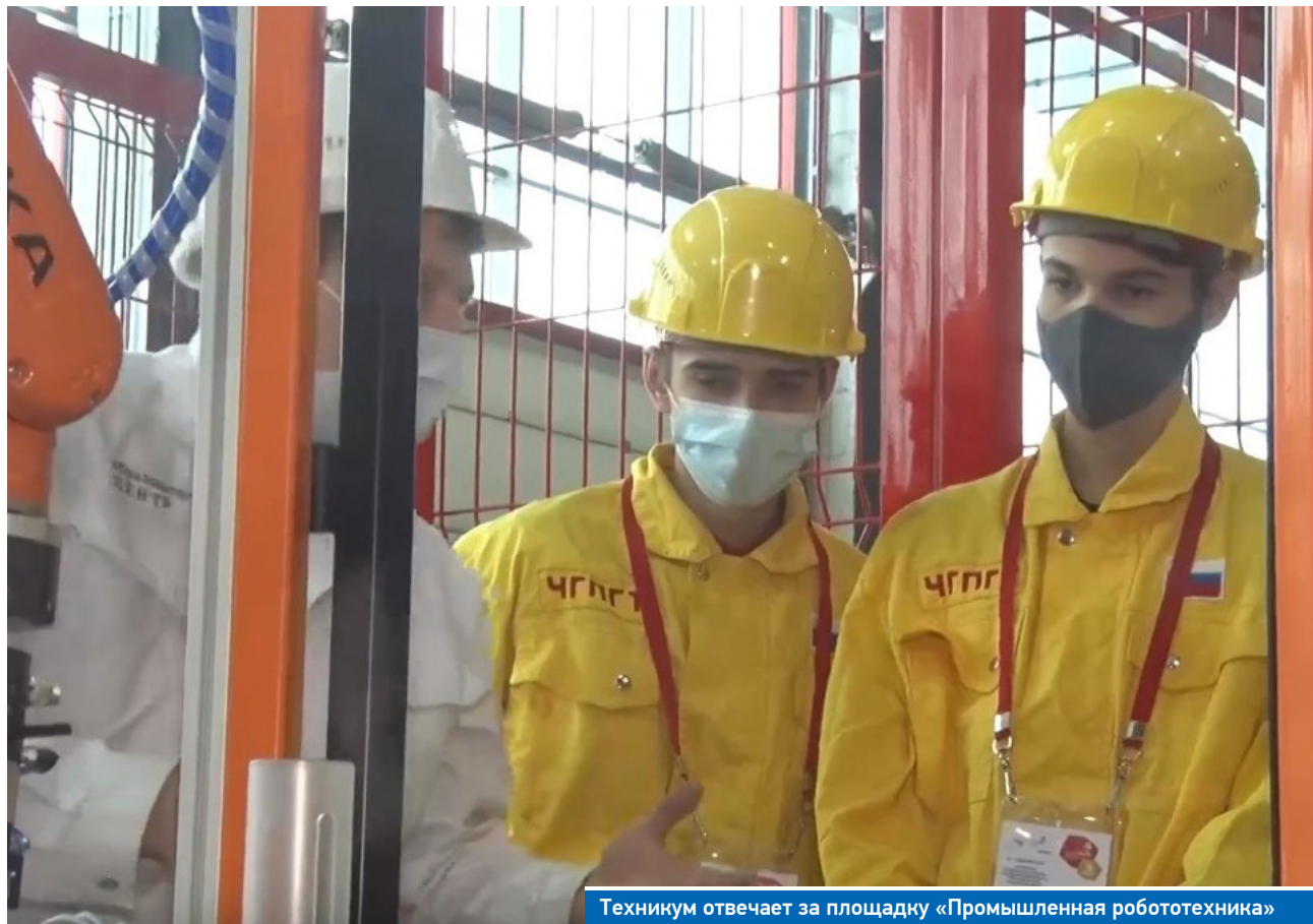
Техникум отвечает за площадку «Промышленная робототехника»

Если участникам IX регионального чемпионата «Ворлдскиллс» соревнования предстоят в ноябре, то те, кто готовится к отборочному этапу VII национального чемпионата «Абилимпикс» выходят на финишную прямую: состязания по ряду компетенций состоятся уже в начале октября.