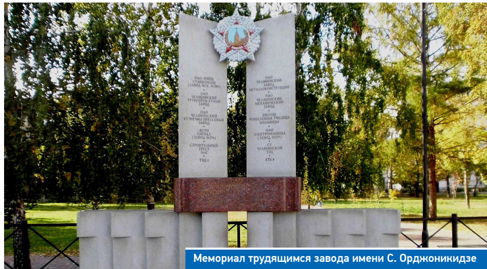
Мемориал трудящимся завода имени С. Орджоникидзе

Старт реализации проекта был дан в сентябре 2020 года. На первом этапе студентам трех образовательных комплексов техникума рассказали о том, как создаются, реализуются социальные проекты. Многим ребятам понравилось узнавать о социальном проектировании и они решили войти в состав проекта и попробовать себя в исследовательской деятельности, а также в качестве будущих экскурсоводов.