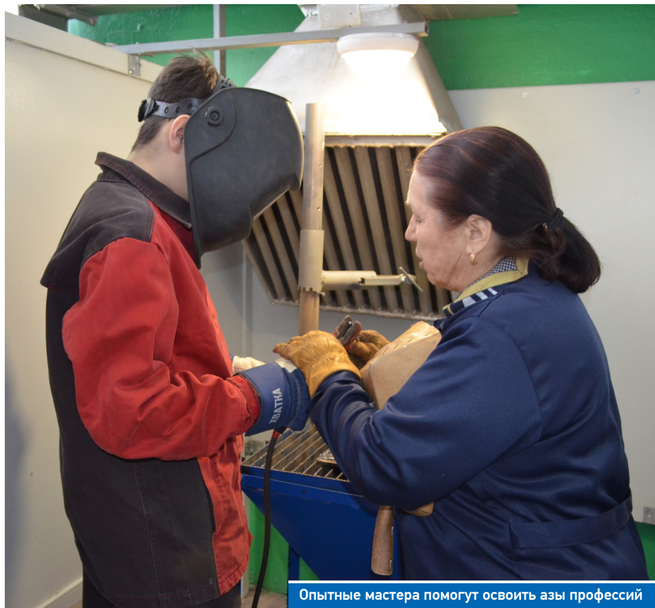
Опытные мастера помогут освоить азы профессий

Первая половина дня смены отводится на мастер-классы, в которых ребята попробуют компетенции «Повар-кондитер», «Электромонтер», «Слесарь-ре-