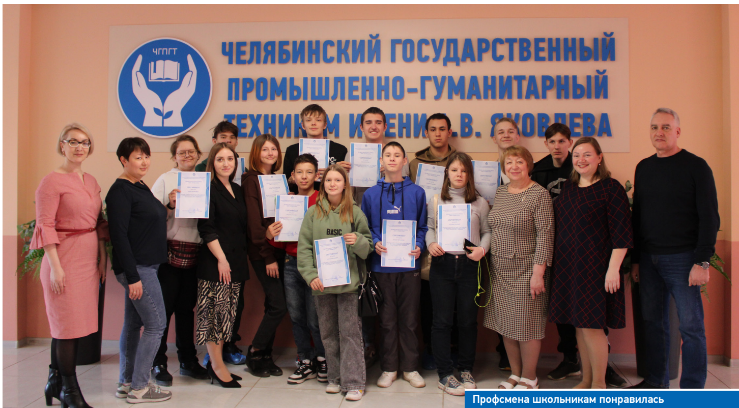
Профсмена школьникам понравилась

В техникуме завершилась профсмена для ребят из школы-интернета