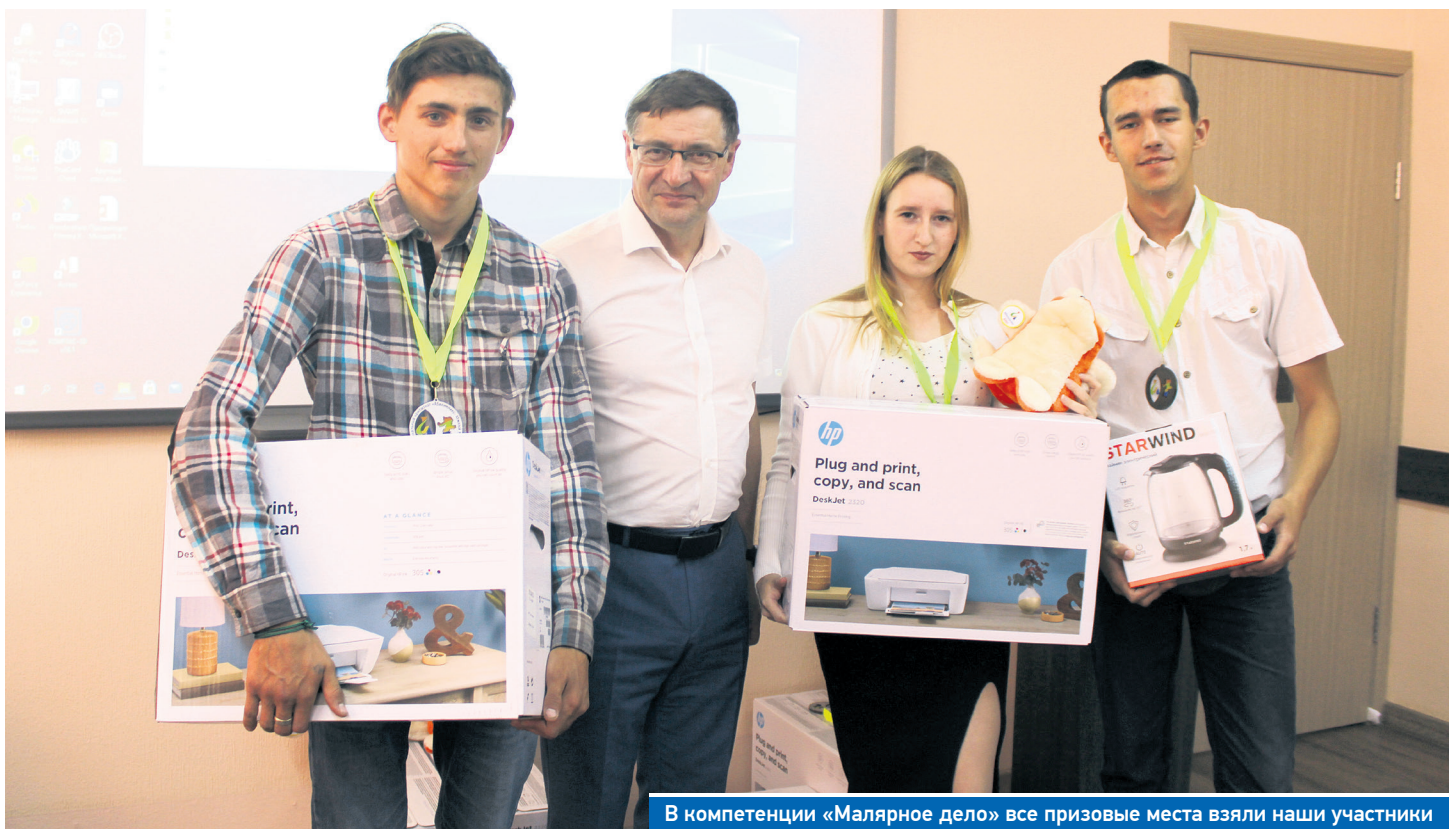
В компетенции «Малярное дело» все призовые места взяли наши участники

Участников чемпионата «Абилимпикс» поблагодарили за успехи